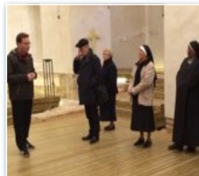
Passeio em Santa Cecília

Os mosteiros beneditinos são reconhecidos por amar e apreciar as artes em suas variadas formas. A arte frequentemente serve como meditação. Nossa visita à Igreja Santa Cecília e ao Instituto de Artes, com a exposição do artista Sean Scully, foi uma experiência de arte e beleza. Aprendemos sobre a história de Santa Cecília, que vai do ano 900 até os dias atuais. Desde 2005, Sean Scully desenvolve um papel importante como o criador das pinturas que ornamentam a igreja. A igreja está impregnada de seu estilo pessoal. Para maiores informações acesse: www.santaceciliamontserrat.com