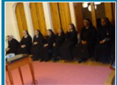
Encontro com as Irmãs da Comunidade de Montserrat